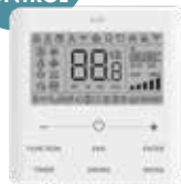
SWC7AV (Optional) 398700039 Comando a filo con WiFi