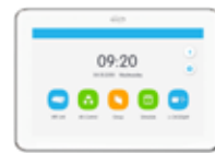
SWC52V (Optional) 398800104 Comando centralizzato fino a 36 unità interne (Richiede un comando a filo per ciascuna unità interna)